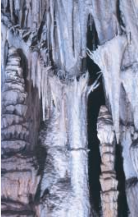
Figura 7: Conjunto de espeleotemas en las Coves de Campanet (Mallorca). Conjunt d'espeleotemes a les coves de Campanet (Mallorca). Speleothem assemblage at Coves de Campanet (Mallorca).

tintos autores. La mayoría de esos artículos se basan en las observaciones realizadas por espeleólogos experimentados, entre los cuales cabe citar a E.A. Martel, J. Maheu, M. Faura y Sans, R. de Joly, N. Llopis-Lladó, J.M. Thomas-Casajuna, J. Montoriol-Pous, J. Ginés, A. Ginés, M. Trias, F. Gràcia y A. Merino, además de otros muchos. En cualquier caso, hay que asumir que el conocimiento de la estructura y espeleogénesis de pequeñas y fragmentarias cavidades individuales, o de las microformas de corrosión que contienen en su interior, no proporcionan por sí mismas más que evidencias de fenómenos locales, difíciles de generalizar a la globalidad de los sistemas kársticos o de las regiones kársticas de las que éstas forman parte integrante.