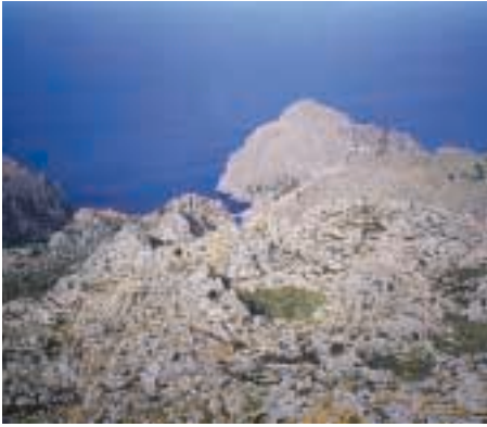
Figura 2: Paisaje kárstico, con dolinas y campos de lapiaz, en los alrededores de Sa Calobra (Escorca, Mallorca). Paisatge càrstic, amb dolines i camps de lapiaz, als voltants de sa Calobra (Escorca, Mallorca). Dolines and karrenfields in a karstic landscape near Sa Calobra (Escorca, Mallorca).

de Formentera. El clima del archipiélago es típicamente mediterráneo, aunque es muy diverso en cuanto a la magnitud de sus precipitaciones anuales: éstas van desde algo menos de 400 mm en las comarcas más áridas (como el sur de Mallorca o las Islas Pitiusas) hasta precipitaciones superiores a los 1.400 mm (en las partes más altas de la Serra de Tramuntana mallorquina). La temperatura media anual se sitúa entre los 13° y los 18°, entre las distintas regiones naturales del archipiélago.