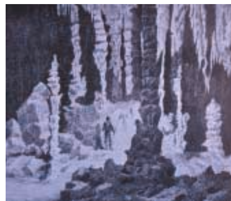
Figura 3: Columnas y estalagmitas en las Coves d'Artà (Capdepera, Mallorca), según una ilustración del siglo XIX. Columnes i estalagmites a les coves d'Artà (Capdepera, Mallorca), segons un gravat del segle XIX. Columns and stalagmites at Coves d'Artà (Capdepera, Mallorca), according to an old drawing from the 19th century.

Las más antiguas exploraciones de cavidades mallorquinas de las cuales ha quedado constancia escrita corresponden a A. Cabrer (1807 exploración de las Coves d'Artà, 1840 fecha de publicación), J.M. Bover (1839, exploración de la Cova de Son Lluís), P.d'A. Peña (1862, topografía de las Coves d'Artà), M. Conrado (1865, exploración del Avenc de son Pou) y F. Will (1880, topografía de les Coves del Drac). Durante esas pioneras exploraciones, además de las adversidades propias del medio subterráneo (iluminación mediante antorchas, difícil orientación en las cavernas más laberínticas, etc.), los exploradores de la Cova