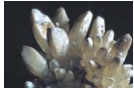
Figura 8: Cristalizaciones de calcita en la Cova des Diners (Manacor, Mallorca). FOTO: ANTONIO MERINO. Cristal·litzacions de calcita a la cova des Diners (Manacor, Mallorca). FOTO: ANTONIO MERINO. Calcite crystals in Cova des Diners (Manacor, Mallorca). PHOTO: ANTONIO MERINO.

Pero sin duda la contribución más original de la espeleología mallorquina al estudio de los espeleotemas corresponde al descubrimiento de las cristalizaciones freáticas que se forman en los lagos de ciertas cuevas costeras. Se trata de sobrecrecimientos freáticos muy particulares, ya que muestran una clara relación altimétrica con las fluctuantes estabilizaciones del nivel del mar ocurridas durante el Cuaternario (GINÉS & GINÉS, 1974; y GINÉS et al., 1981). Desde entonces, esta línea de investigación ha dado lugar a diversas publicaciones sobre el origen y las características mineralógicas de estos espeleotemas freáticos costeros (POMAR et al. 1976 y 1979). También ha generado una larga lista de dataciones efectuadas mediante el método de las series de Uranio. Las dataciones radiométricas comenzaron a ser publicadas en los años 80, con el avance de los primeros resultados por parte de HENNIG et al. (1981), y han continuado en la actualidad gracias a recientes contribuciones como las de VESICA et al. (2000) y TUCCIMEI et al. (2000). Las más de 40 dataciones de espeleotemas asociados con cambios de nivel del mar, junto con su respectiva descripción morfológica, mineralógica y cristalográfica, constituyen parte sustancial de una tesis doctoral (GINÉS, 2000b) presentada hace poco en la Universitat de les Illes Balears.