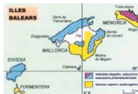
Figura 1: Principales regiones kársticas de las Islas Baleares. Principals regions càrstiques de les Illes Balears. Main karstic regions in the Balearic Islands.

Cave explorations started early during the 19th century in Mallorca. The older cave publications were rather literary accounts, being short of accurate descriptive data. In 1862 the Majorcan learned Pere d'Alcàntara Peña achieved the first cave survey of Coves d'Artà, a remarkable speleological document because of its accuracy. Outstanding contributions were made between 1896 and 1905, namely: the Coves del Drac exploration and survey by Edouard A. Martel, the description of the aquatic troglobite species Typhlocirolana moraguesi by Emil G. Racovitza and the study on fossil bones of endemic vertebrates found in caves by Dorothea M.A. Bate. Several pioneer exploration campaigns occurred between 1911 and 1963, being specially remarkable those carried out by several French and Catalan caving groups, some of them under the leadership of Robert de Joly, Noel Llopis and Joaquim Montoriol. During the seventies, Majorcan caving groups began their activity increasing quickly the available knowledge on cave and karst all over the Balearic Islands. A lot of speleological work has been produced in the last 30 years as a result of enhanced relations between many cavers, integrated into caving groups, and individual scientific researchers interested on caves and karst. Today, the vast majority of current knowledge on Balearic caves and karst is brought together in the 24 issues of Endins , the publication of the Federació Balear d'Espeleologia