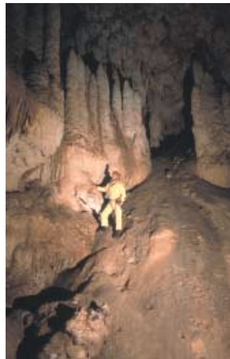
Figura 11: Cono de arenas de procedencia dunar, en el interior de la Cova de Sa Bassa Blanca (Alcúdia, Mallorca), a 25 metros de profundidad. Con d'arenas pleistocèniques d'origen dunar, a l'interior de la cova de sa Bassa Blanca (Alcúdia, Mallorca), a 25 metres de profunditat. Eolianite conical deposit found in Cova de Sa Bassa Blanca (Alcúdia, Mallorca), at a depth of 25 meters.