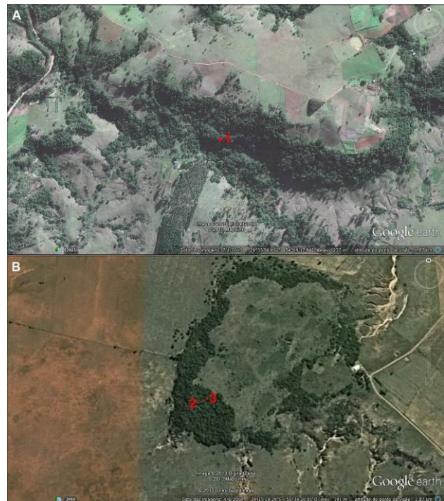
Figura 2. Imagens de satélite mostrando a área de entorno das cavernas visitadas. A. Entorno da Caverna do Faxinal (1) em São Pedro do Sul, RS. B. Entorno das cavernas Kid Bairro (2) e Rincão dos Pintos (3) nos arredores do município de Manoel Viana, RS. Note que o nível de detalhamento dos mapas difere em função da disponibilidade das imagens no programa e da altitude da área mostrada, mesmo que as imagens tenham sido tomadas na mesma altitude do ponto de visão (1,87 km).

Uma grande presença de morcegos Desmodus é um problema que pode estar relacionado com impactos promovidos na cavidade ou em seu entorno, já que espécies frugívoras e insetívoras tendem a ser bem mais sensíveis à presença humana, abandonando locais impactados e dando lugar à ocupação por morcegos menos sensíveis e que acabam por causar transtornos à criação de gado (VOIGT; KELM, 2006, LEE et al., 2012). Em conversas com a população da região, percebemos que o fechamento de entradas das cavidades bem