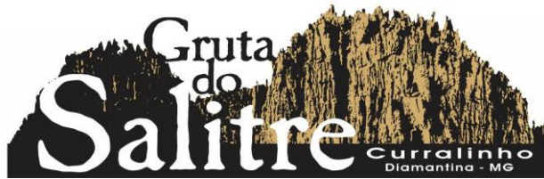
Figura 6. Logomarca do atrativo natural evidenciando a identidade visual do atrativo associada ao nome da Comunidade de Curralinho.