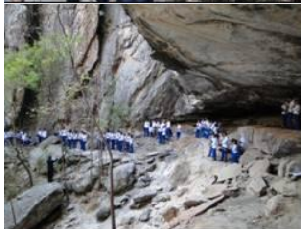
Figura 3. Eventos culturais que ocorrem no complexo da Gruta do Salitre, Diamantina, MG.