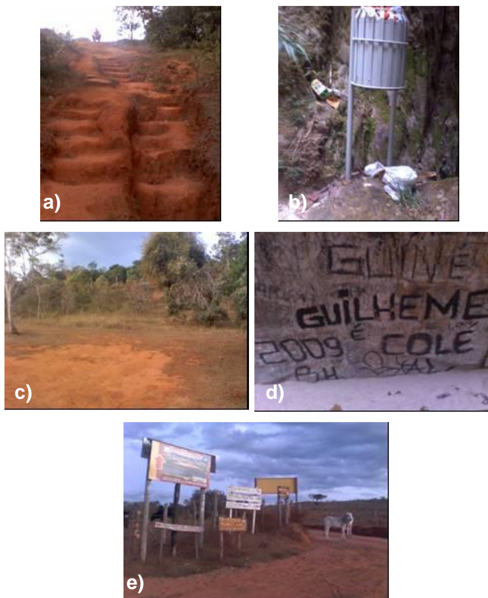
Figura 4. Imagens do cenário atual da Gruta do Salitre: a) Acessos precários; b) Lixeiras não monitoradas; c) Área de estacionamento em abandono; d) Depredação da gruta; e) Sinalização confusa e deficiente.