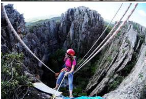
Figura 2. Atividades esportivas que ocorrem no complexo da Gruta do Salitre, Diamantina, MG.

Concertos musicais que atraem uma grande quantidade de pessoas de uma só vez a gruta também vêm ocorrendo uma vez por ano, há pelo menos 10 anos, na porção da claraboia (Figura. 3).