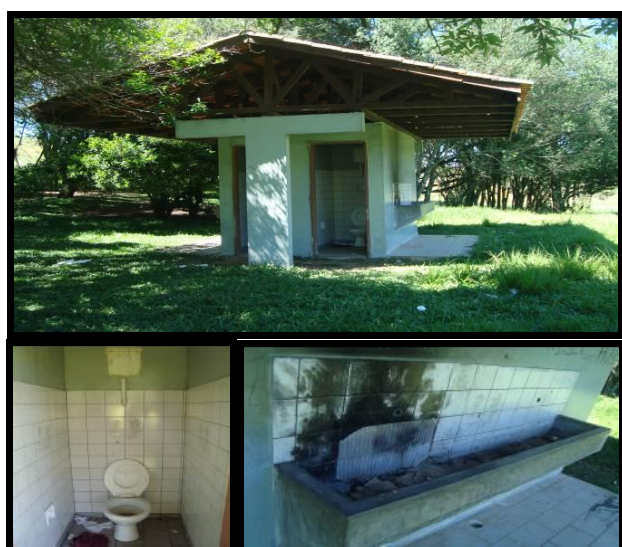
Figura 03 – Banheiro ( Registro em 02.11.2010)