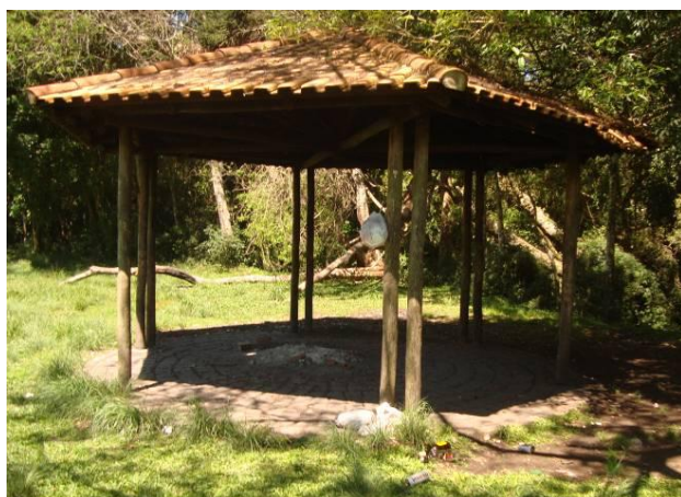
Figura 01 – Quiosque

de uma década. O local é visitado por um público diverso, constituindo assim um ambiente fértil para diferentes representações, onde a natureza – assim como o espaço – passa a ser objeto dessas representações, resultando em uma dinâmica representacional que pode ser capaz de modificar até mesmo a própria relação de sociedade-natureza existente.