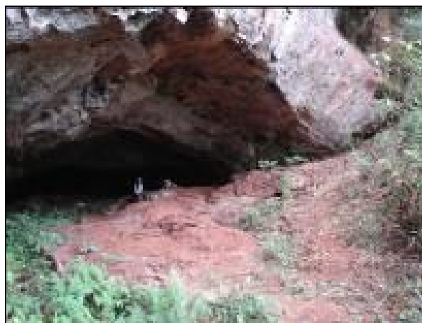
Figura 01: Entrada da gruta Água Virtuosa I. Autor: Spoladore, 2007.

O teto da cavidade é relativamente plano, com poucos espeleotemas e ornamentos. No final da cavidade o teto sofre rebaixamento diminuindo sensivelmente a altura da caverna.