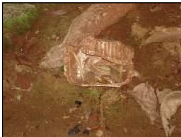
Figura 06: Resíduos sólidos encontrados no interior da gruta Água Virtuosa I.