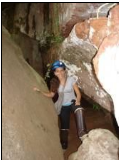
Figura 04: Entrada da gruta Água Virtuosa II.

originando o ornamento conhecido como “caixa de ovos”. Outros ornamentos observados nesta cavidade são as formas coralóides (“couve-flor”) e “pipoca”, espeleotemas comuns em cavidades psamíticas e descritos anteriormente por Spoladore (2006). Localmente, em locais onde ocorre o gotejamento, foram observados estalactites centimétricas compostos por minerais de sílica.