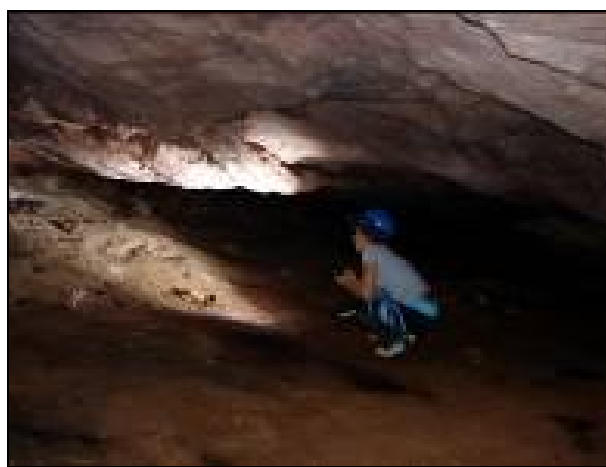
Figura 03: Detalhe do pavimento interno da gruta Água Virtuosa II.

Conforme pode ser verificado na Figura 03, a cavidade em questão é composta por apenas um grande salão com aproximadamente 40 metros de desenvolvimento com uma altura média de 1, 50 metro (um metro e meio).