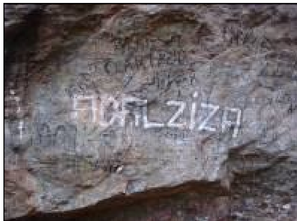
Figura 05: Pichações nas paredes externas da gruta Água Virtuosa I.