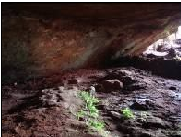
Figura 02: Depósitos de sedimentos no pavimento interno da gruta Água Virtuosa I. Autor: Spoladore, 2007.

No pavimento interno da caverna observa-se grande quantidade de depósitos de sedimentos arenosos e argilosos (figura 02). Estes materiais são provenientes do meio externo, possivelmente trazidos por enxurradas. Os blocos observados no interior da caverna, apresentam-se arredondados e com evidências de transporte, indicando assim que na realidade são blocos rolados não abatidos.