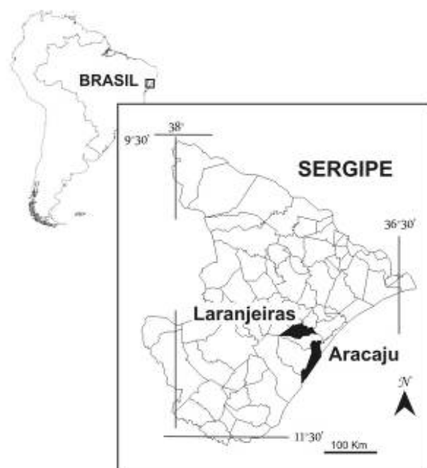
Figura 1. Localização do município de Laranjeiras, Sergipe, Brasil.

coordenadas 10^{\circ}48'79,1''S e 37^{\circ}10'44,4''W , possui três entradas: a primeira entrada possui uma largura de 1,31m, altura de 1,35m e dá acesso ao único salão adentrado que tem altura de 3,07m e 6,47m de desenvolvimento horizontal, no qual o piso estava repleto de estalactites quebradas por ação antrópica. A segunda entrada apresenta dimensões menores, com 0,97cm de altura e largura de 1,05cm. É importante esclarecer sobre o fato de não terem sido incluídos as medidas da terceira entrada devido às dificuldades com a presença de maribondos, porém, serão feitas essas medições assim que as condições forem mais favoráveis.