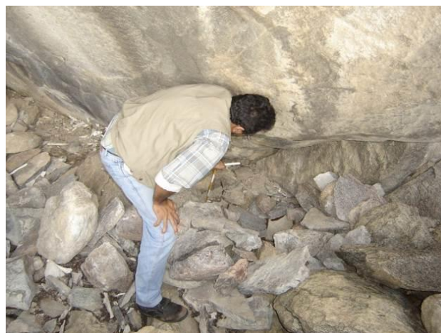
Figura 5 – O abrigo rochoso sítio Pinturas I em seu interior.

Com relação ao tamanho do abrigo rochoso em que jazem os restos esqueléticos dos indivíduos inumados no sítio Pinturas I, segue um padrão já identificado, no semiárido do Nordeste, pois, tratam-se de lugares com poucas dimensões de largura, altura e profundidade que não ultrapassa 5 ou 6 mts, mas sempre protegidos das intempéries (Figura 5).