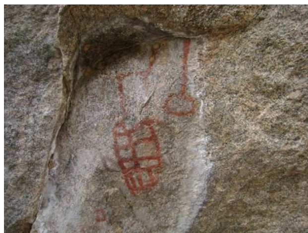
Figura 2 – Figuras rupestres existentes nas paredes internas (suporte rochoso) do sítio Pinturas I, São João do Tigre, Paraíba, Brasil.