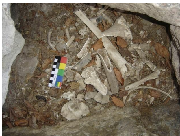
Figura 3 – Escavação do abrigo rochoso sítio Pinturas I, Paraíba, Brasil, nitidamente vandalizado (fragmentos de ossos humanos).

As atividades de escavação do sítio Pinturas I foram prejudicadas pelo elevado grau de depredação do ambiente onde jaziam os restos esqueléticos de alguns indivíduos (Figura 3).