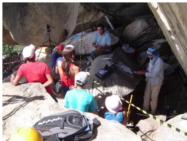
Figura 4 – Atividade de Educação Patrimonial durante a escavação do abrigo.

Um das atividades mais interessantes desenvolvidas antes e durante a escavação do sítio Pinturas I, foram as palestras para a comunidade, especialmente com o recebimento de centenas de alunos da região que visitaram a escavação, desmistificando o mito da botija e mostrando-lhes o papel do arqueólogo num sítio arqueológico (Figura 4) e espeleológico.