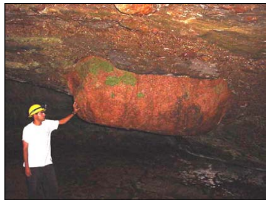
Bloco de granito no teto da Gruta Caruana 3. A caverna se desenvolveu em meio a diamictito. Os blocos e seixos no teto da caverna, devido à erosão diferencial, ficaram expostos tornando-se assim, espelegens.

Painel 03 – Ornamentos encontrados nas cavernas estudadas