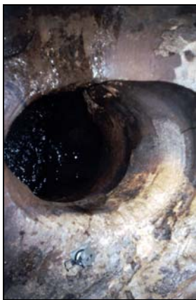
Clarabóia. Autor: Ângelo Spoladore.