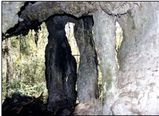
Colunas compostas por calcita. Autor: Ferdinando Nesso.