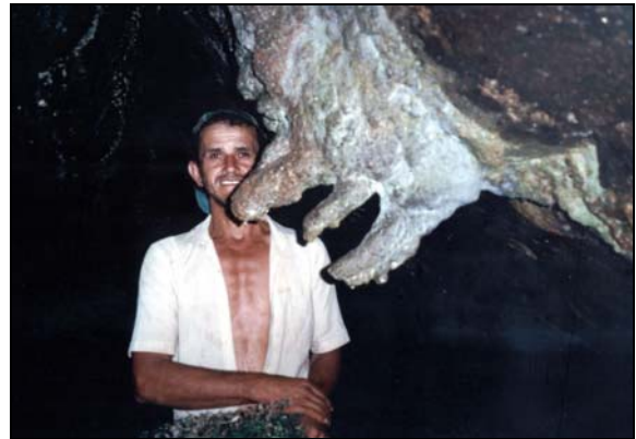
Estalactites encurvadas. Autor: Ferdinando Nesso.