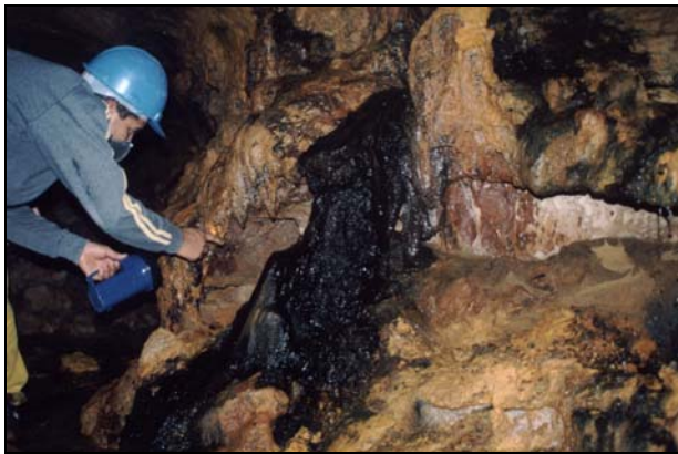
Cascata de rocha composta por calcita. Autor: Ângelo Spoladore.