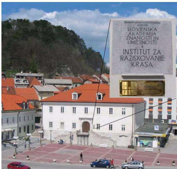
Foto 06 – Fachada do KRI em Postojna, na Eslovênia, com detalhe da placa da UIS.

UIS, listagem dos Delegados, listagem das Comissões e Grupos de Trabalho, além de links com as websites de todas as Comissões, Federações Nacionais de todos os Países Membros. O endereço da UIS é: http://www.uis-speleo.org . Desde 20 julho de 2002 a UIS tem o seu endereço fixo na Titov trg 2, em Postojna, na Eslovênia, em espaço concedido pelo governo daquele país através do Instituto de Pesquisa do Carste (KRI), da Academia Eslovena de Ciências e Artes, Foto 06.