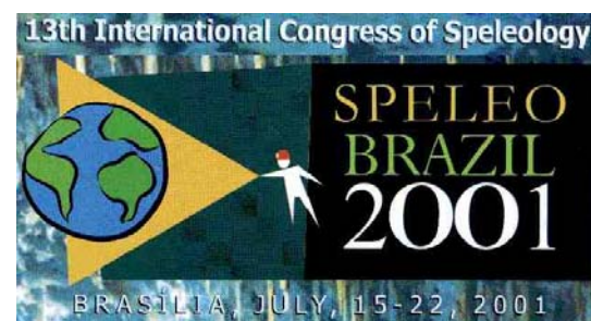
Figuras: 02, 03 e 04 - Logotipos de alguns CIE – Congressos Internacionais de espeleologia: respectivamente do 1º CIE (Paris-1953), do 4º CIE (Postojna-1965), quando foi fundada a UIS e 13º CIE (Brasília-2001), realizado no Brasil e o primeiro no hemisfério sul.