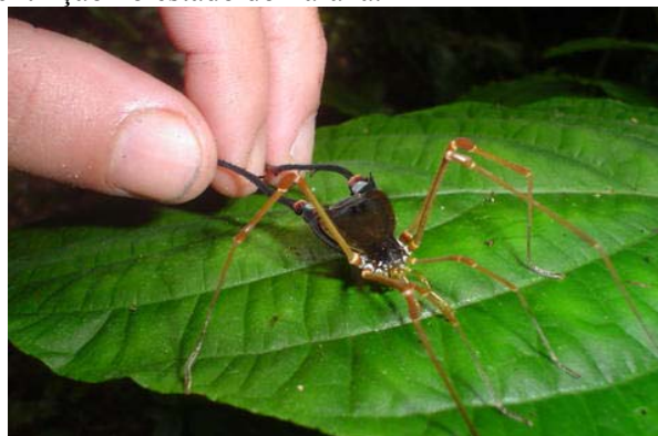
Fotografia 4- Opilião Cadeadoius niger . (Robson A. Zampaulo)

O morcego Chrotopterus auritus é considerado como um dos cinco maiores do Brasil. Carnívoro, alimenta-se de pequenos vertebrados como aves, répteis, morcegos e roedores, embora alguns autores tenham relatado a presença de insetos e frutos na sua dieta. Trata-se de uma importante espécie, sendo encontrada apenas em ambientes preservados que possibilitam uma adequada variedade de presas. (MEDELLÍN, 1989) e encontra-se na lista de espécies ameaçadas de extinção no estado do Paraná.