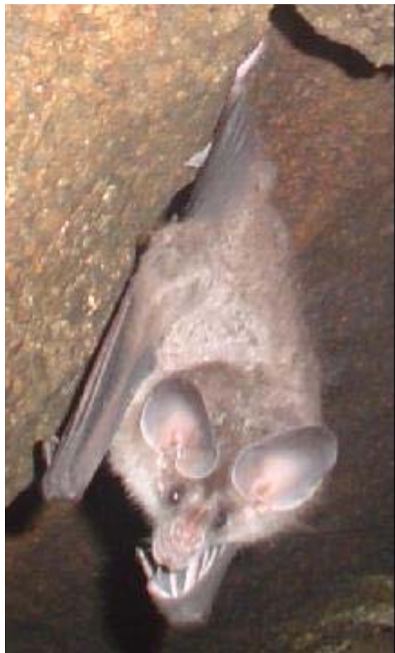
Fotografia 5- Morcego Chrotopterus auritus . (Robson A. Zampaulo)

Os trabalhos da Equipe 3 , pautaram-se no levantamento preliminar da micota cavernícola (fungos) da região do Rolado e Frias, onde foram encontradas oito espécies frutificadas em troncos e ramos de árvores em estágio elevado de decomposição, todas ao nível do rio e em zona fótica ou de penumbra, condição que promove o desenvolvimento dos corpos de frutificação.