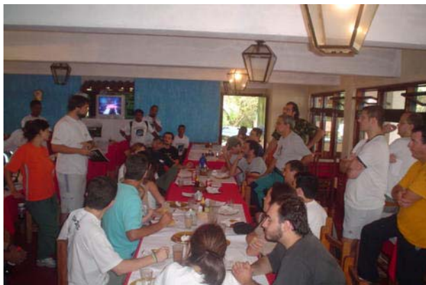
Fotografia 2- Reunião das Equipes no Restaurante Kaverna.