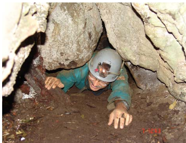
Fotografia 3- Entrada Gruta do Rala-Cotovelo (Flávia R. Pereira)

descoberto um campo de uvalas muito propenso para grutas e abismos, apesar do difícil caminhar na mata fechada.