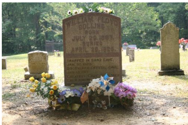
Figura 2 – Lápide de Floyd Collins (Alan Jabbour; Fonte: http://www.alanjabbour.com/sitebuilder/images/Floyd_Collins_gravestone-511x336.jpg ).