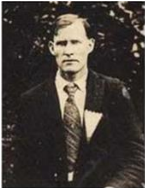
Figura 1 – Floyd Collins.