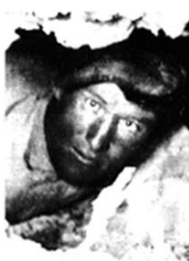
Figura 3 – Floyd Collins, ainda acessível.

Trabalhando sozinho por um período de três semanas, ele expandiu e explorou um buraco que mais tarde seria apelidado de Sand Cave pela mídia. Em 30 de janeiro de 1925, depois de algumas horas de trabalho, Collins conseguiu se espremer através de várias passagens estreitas; ele alegou que havia descoberto uma grande câmara, mas essa afirmação nunca foi confirmada. Devido a sua iluminação estar acabando, ele precisou sair rapidamente, antes mesmo de poder explorar a nova câmara. No entanto, bateu acidentalmente sua lâmpada, ficando completamente sem luz e, ainda, atingindo uma rocha do teto, que veio a cair, prendendo uma de suas pernas (Figura 3).