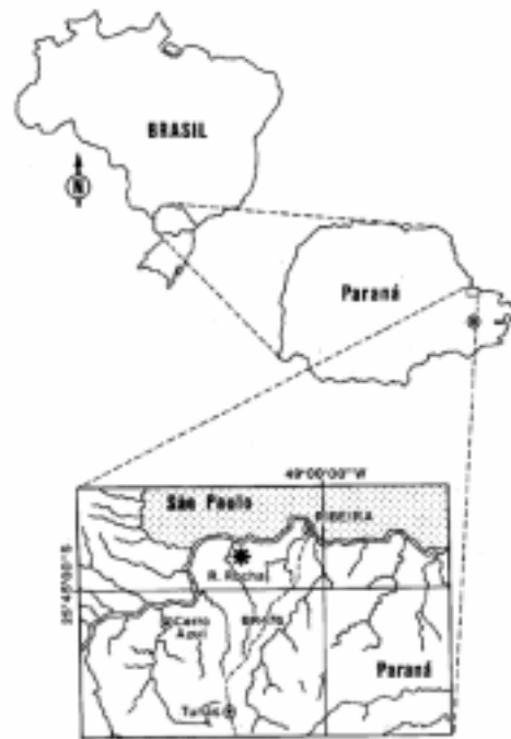
Fig. 1. Localização geográfica das cavernas do vale do Rio do Rocha, localidade de Gramados (*), de onde procedem os espécimes estudados.

igual do M_3 correspondem respectivamente a 2,05 cm e 2,0 cm. O M_4 é suavemente curvado, sendo côncavo na face bucal e convexo na face lingual. Em vista oclusal M_4 tem forma de “y” sinuoso com vértice situado lingualmente, seu diâmetro mesio-distal é de 3,65 cm e o buco-lingual é de 2,4 cm.